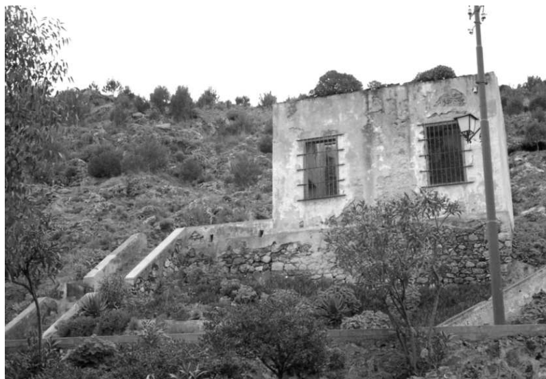
Il cameroncino della Rotonda, 30 mq, senza servizi igienici, cancello e grate alle finestre, in cui furono alloggiate alcune internate slave.