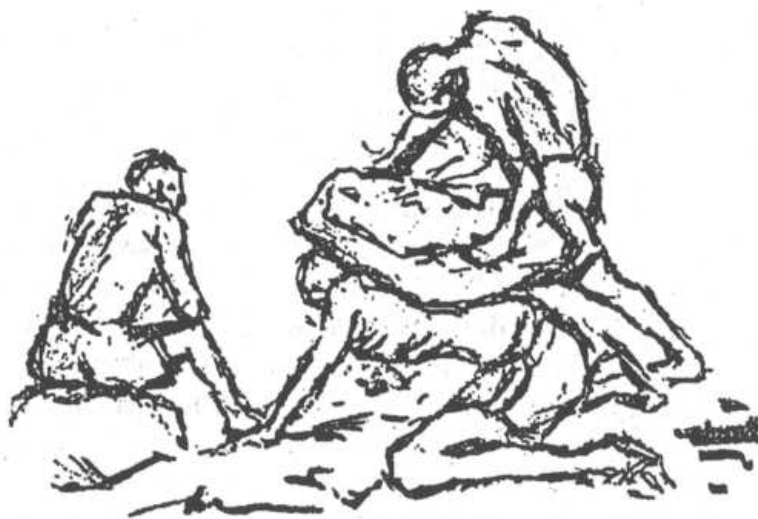
A Goli Otok , la pietra, inutilmente spezzata e inutilmente trasportata a dorso nudo o con zaviere da un punto all'altro dell'isola diventa strumento di tortura.