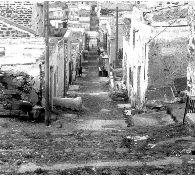
Ustica, Via Calvario nel 1943. Le povere case del rione Calvario erano abitate dai confinati "privilegiati" autorizzati a prenderle in affitto.

di Castel Jablanizza, alloggiò in Parrocchia con i Cappuccini (era stato internato «per manifesti sentimenti antitaliani in quanto mai ha esternato il desiderio di iscriversi al PNF, evita le autorità e per cultura capace di attiva propaganda ai nostri danni» 4 ).