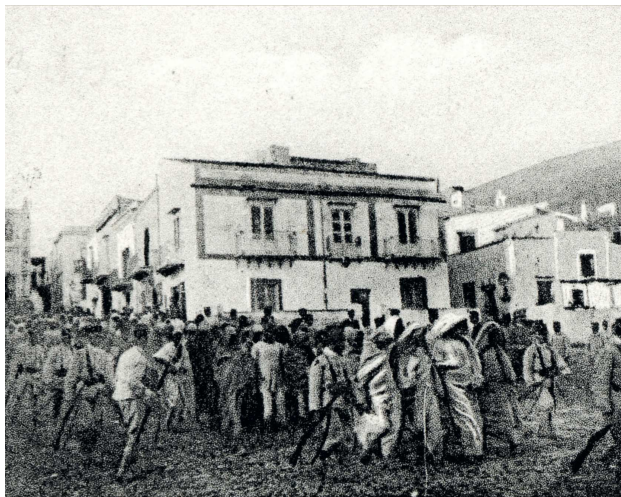
Ustica 1911. Relegati libici, scortati dai militari, vengono condotti al bagno, una delle misurure sanitarie tendenti a evitare il propagarsi del colera.

Non sfuggono inoltre a Genco le venature razzistiche che caratterizzano le cronache di quei giornali "filogovernativi" , dove si legge, per esempio, dell'arrivo dei deportati nell'isola nei termini di una "invasione di cenciosi" , di arabi dallo "sguardo cupido proprio del predone" e dall' "aspetto ferino" , di gente che ha "rifiutato il letto" e che "resta tutto il giorno accoccolata sui pagliericci buttati a