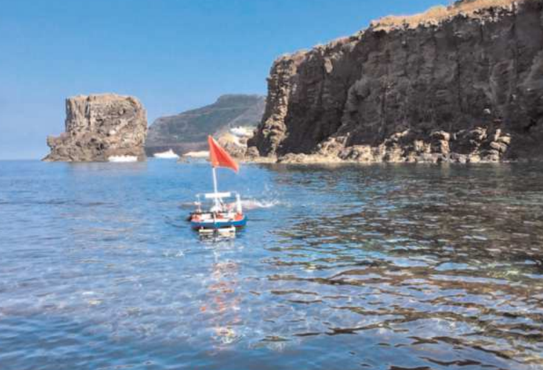
Barchino strumentale con cui vengono effettuati i rilievi geomorfologici della costa di Ustica, nell'ambito del progetto "Geoswim" diretto dal prof. Stefano Furlani dell'Università di Trieste.

anche lungo il muro di cinta difensivo, sotto forma di consistenti crolli e dislocazioni. La muraglia, invece, è sostanzialmente integra, a parte i saccheggi operati dall'uomo, soprattutto nella sua parte sommitale, dove i massi furono asportati e utilizzati come materiale da costruzione, prima che la Soprintendenza mettesse sotto tutela l'intera area.