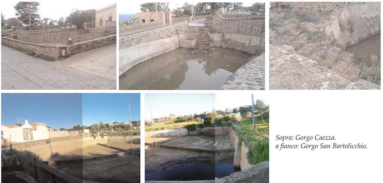
Sopra: Gorgo Caezza. a fianco: Gorgo San Bartollicchio.

che secondo la stima del Pigonati poteva bastare alle esigenze della popolazione e alla nascita di un nuovo centro abitato, in realtà si rivelò insufficiente (Ailara 2005:14) e per questo ci si dovette subito impegnare per l'immediato utilizzo delle antiche cisterne e dei gorghi. D'altronde i suggerimenti del Valenzuola erano stati recepiti nel bando del 14 marzo 1761, con il quale il re Ferdinando di Borbone diede il via all'edificazione di tutte le strutture civili, militari e religiose che portarono Ustica a diventare Universitas nel 1771: «e parimenti saranno con denaro della R.C. accommodate le cisterne guaste, e il recipiente d'acqua della Grotta di S. Maria esistente in detta Isola per ridurle a segno di poter ricevere quella quantità d'acqua più pura, e perfetta da bere che sarà bisognevole per gli abitanti sudetti» (De