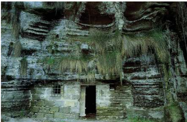
Parete di tufo lungo la via Mezzaluna, a monte della centrale elettrica.