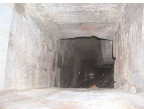
Cisterna in casa Di Lorenzo.