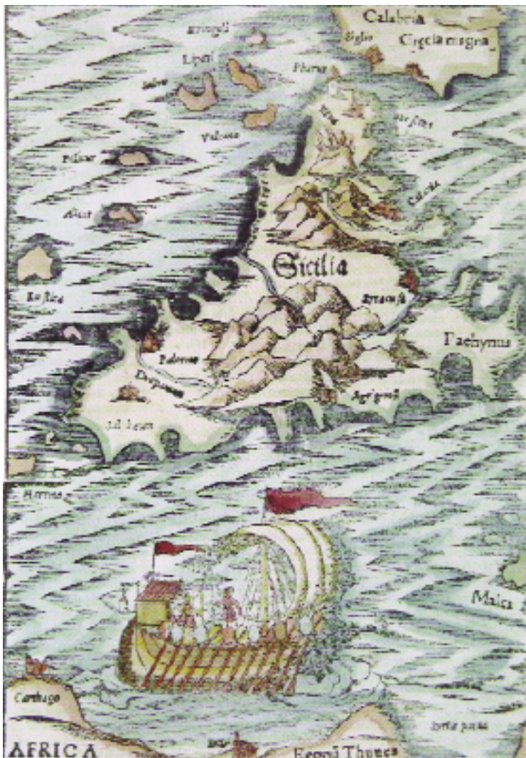
Munster, Sebastian (1489-1552). Xilografia tratta da Cosmographiae universalis... , Basilea 1550. Ustica è indicata con l'antico toponimo "Lustica".

Una fra le più antiche testimonianze cartografiche della Sicilia è la Tabula Peutingeriana . La crescita della dominazione romana costrinse i geografi ad estendere le rilevazioni a territori sempre più lontani e a stabilire i cosiddetti itinerari che avevano finalità esclusivamente di carattere militare e che possono oggi essere definiti delle carte stradali ante-litteram. La rappresentazione, eseguita ai tempi di Teodosio Magno alla fine del IV secolo, contiene i lineamenti delle terre e della rete stradale dell'Impero Romano, dalla Penisola Iberica al Mar Caspio. La tavola venne ridisegnata dal geografo Castrius verso il XIII secolo su un rotolo membranaceo lungo 6,75 metri e largo 34 centimetri. La carta, composta da undici seg-