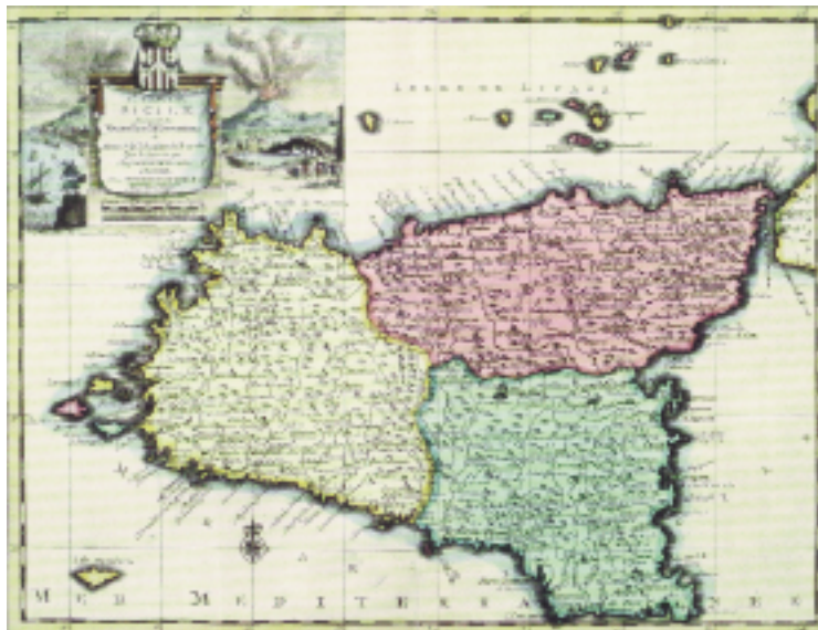
Vander, Pierre (1659-1733). Incisione su rame all'acquaforte tratta da La Galerie Agrøable du Monde...Leida 1729. I colori distinguono le tre Valli: Val di Mazara, Val demone, Val di Noto. Sullo sfondo del cartogl veduta animata con due vulcani in eruzione.

Contemporaneamente in Italia ed in Europa i cartografi cercavano nuove fonti storico-geografiche per la produzione di carte più vicine alla conoscenza dell'epoca, sia dal punto di vista della proiezione grafica che della descrizione del territorio. Le nuove edizioni della Geografia, man mano venivano arricchite da tavole riguardanti le terre nuove che venivano scoperte, l'edizione stampata a Roma nel 1508 da Marcus Beneventanus