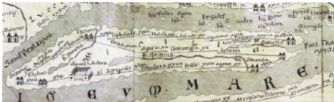
La Sicilia nella tabula Peutingeriana

rende la rappresentazione deformata, compressa, consentendo la consultazione degli itinerari in formato portatile. Venne inclusa in diverse opere geografiche e di viaggio 1 ma, nella grandezza originale, venne pubblicata solo nel