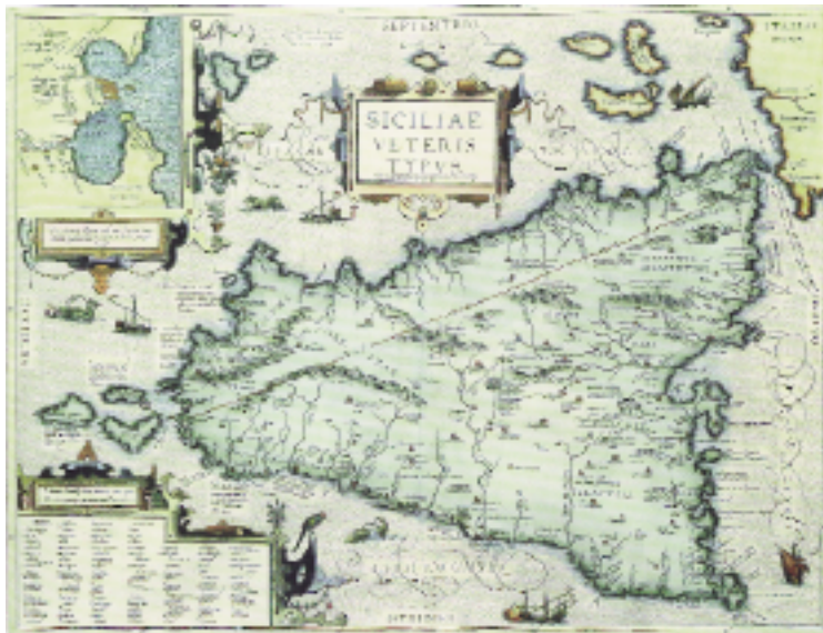
Ortel (Ortelius), Abraham (1527-1598). Incisione su rame all'acquaforte tratta da Addimentum ... Teatri orbis terrarum, Anversa 1570 .

1753. La Sicilia è rappresentata con diversi toponimi che riguardano le città ( civitates ), le tappe dell'itinerario ( manscones ), i luoghi di cambio dei cavalli ( mutatio-nes ), l'idrografia e l'orografia 2 .