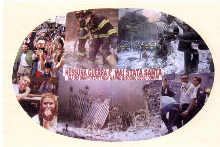
“Nessuna Guerra”, Arte e professione , Firenze 2002, collage, cm 70x100.