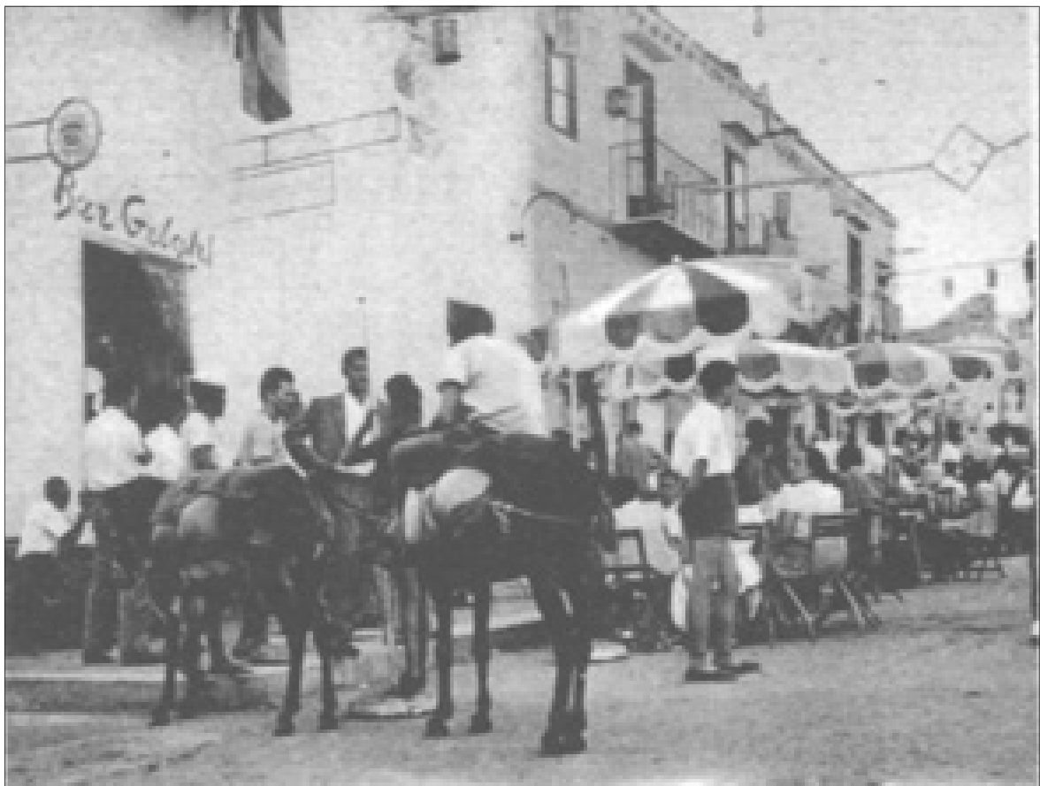
Agosto 1958. Asini nei pressi del bar; turisti ai tavoli allineati nella piazza sotto piccoli ombrelloni.