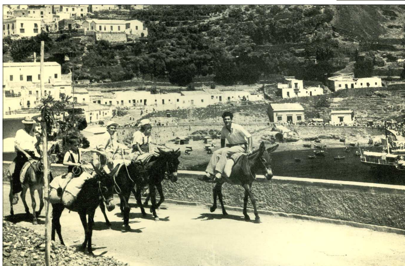
1958. Cinque asinelli ritornano dal porto con i loro padroni sconsolati per non aver trovato turisti da portare a spasso.

(Archivio Centro Studi e Documentazione Isola di Ustica)