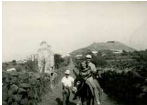
1959. Una allegra coppia di giovani turisti sulla strada di Tramontana affronta trazzere sconnesse per fare il giro dell'isola in asinello.