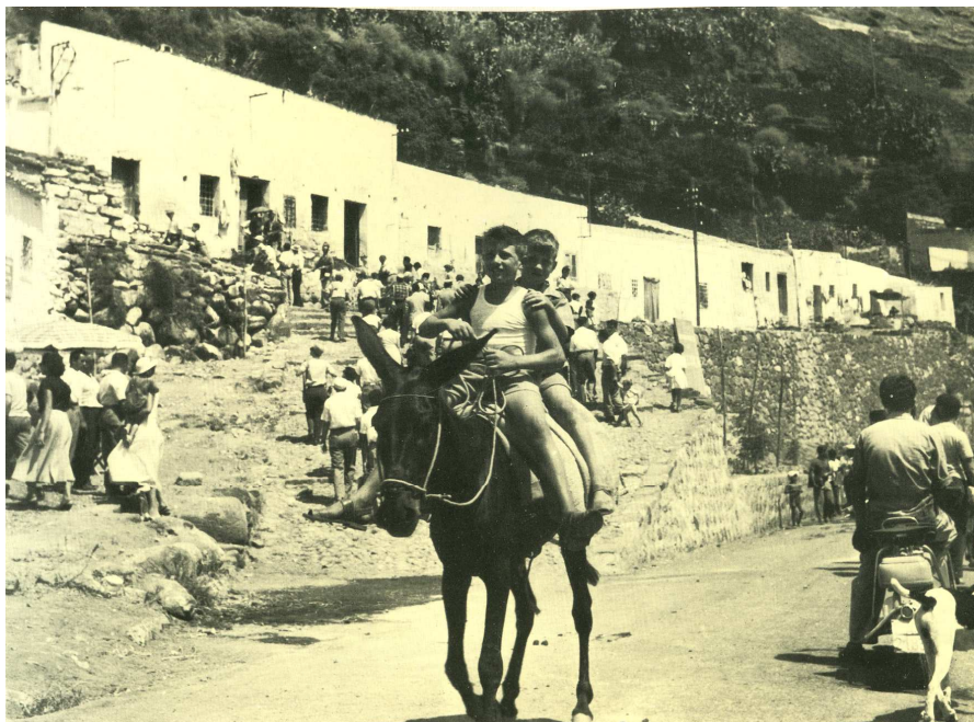
1958. Arrivo della nave: gruppi di turisti domenicali si avviano verso la piazza del paese per la vecchia Via Marina; a destra la prima Vespa circolante nell'isola; a sinistra il primo punto di ristoro; al centro scena, l'asinello disponibile per i turisti.