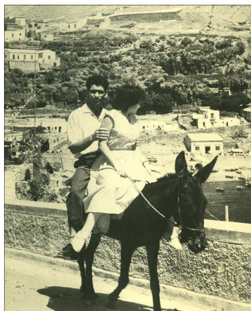
1958. Una turista dal porto accompagnata dal "taxista" sale in paese con l'asinello.