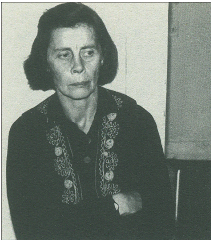
Amelia Rosselli (1930-1996) all'età di cinquantotto anni.

19 giugno vi saranno i funerali a Parigi, presente anche la folla parigina. Il processo contro gli assassini dei fratelli Rosselli inizierà a Roma alla fine di gennaio del 1945. Marion si costituisce parte civile, difesa da Calamandrei e Carocci 5 . Amelia aveva soltanto quindici anni. Tutti questi tragici eventi segneranno l'esistenza di Amelia fatta di spaesamento, sradicamento, inappartenenza. Una vita tormentata che si concluderà con un suicidio a Roma, in via del Corallo, nel 1996 6 . Quelle morti marchieranno la vita e l'opera di Amelia Rosselli a far capire che scrivere e vivere sono una cosa seria, e molto spesso sono la stessa cosa, soprattutto quando segnati da una tragedia. Perennemente alla ricerca di un'appartenenza mai acquisita, Amelia parte, con sua madre, molto depressa a causa della morte del suo compagno di lotta, dalla Francia, nel 1939, do-