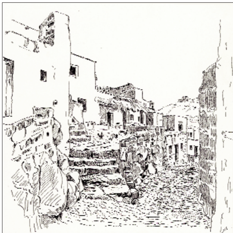
Veduta di una stradina di Ustica nei disegni di Luigi Salvatore arciduca d'Asburgo, autore di una documentata storia di Ustica.

Severino segue volontariamente Guglielmo dentro il Criminale , una specie di camera di correzione, dove venivano imprigionati i relegati, che oltrepassavano i limiti stabiliti, l'amicizia sembra essere la motivazione principale del comportamento di entrambi. Il riferimento a questo legame affettivo in un luogo come il Criminale , che viene descritto in tutta la sua terribilità infernale («...in mezzo a quel fumo grida, bestemmie, canti, urli...»), introduce un elemento positivo, una leggera vena ironica e quasi una via d'uscita in quell'ambiente perduto, dove sono riprodotte le gerarchie e le modalità camorriste: si mangia e si canta, ma l'autore chiama fuori il lettore da questo tristo convito (Noi non parleremo dei brindisi ch'ebbero luogo, perché la nostra penna non è tanto corta da misurare i versi, né tanto lunga da misurare le rime), come a dire che c'è poco da cantare e non è il caso di dilungarsi.