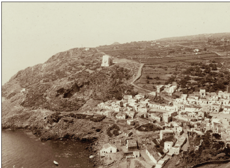
Una veduta di parte del centro abitato prospiciente la Cala Santa Maria di epoca coeva al centro abitato.