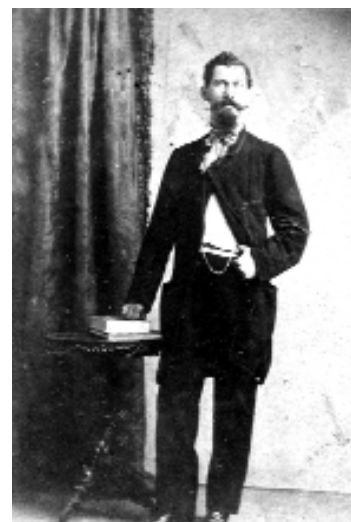
Pietro Minneci Mezzasalma, autore del racconto, protagonista del Risorgimento siciliano, fu confinato politico a Ustica per la sua opposizione ai Borbone.

zo, anche un atteggiamento umano nei confronti della ricchezza, valido universalmente. La strategia usata per gli incontri tra i due giovani, invece, è un documento storico, proprio del tempo, utile a comprendere la distanza tra gli usi del passato e quelli odierni, dopo l'emancipazione della donna.