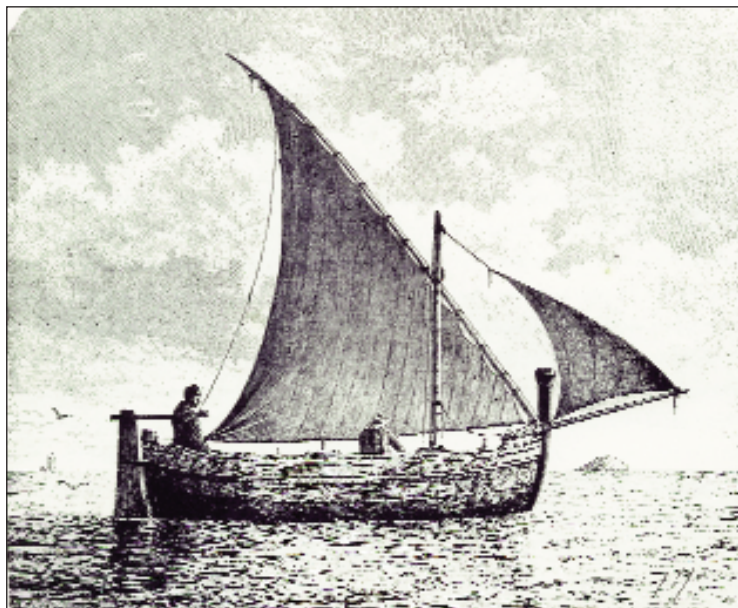
Il paranzello, barca a un albero e vela latina, ai tempi in cui Minneci fu relegato a Ustica era l'imbarcazione che collegava Ustica con Palermo.

Lo stile. L'elemento letterario del libro sta nel suo stile, che si avvale delle informazioni e del metodo, tratti dalla storia, dalla filosofia, dal positivismo, dalla sociologia, dalla statistica e dalle altre scienze, sublimando il tutto con l'invenzione artistica, che costituisce la sola competenza di uno scrittore, insieme all'esigenza di portare nella letteratura l'intero bagaglio del personale sapere esistenziale, emotivo, spirituale e culturale. Se il racconto si svolge dentro i limiti della realtà sociale, tipica di Ustica in un determinato periodo storico, le modalità di scrittura fanno intuire un'intelli-