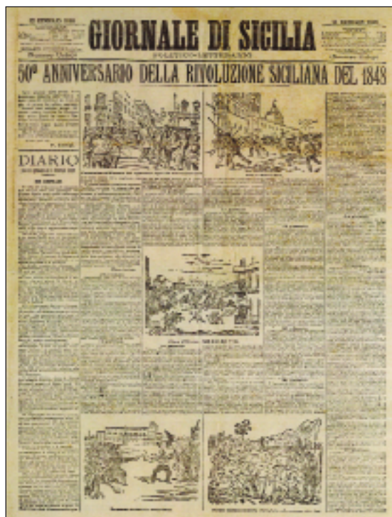
Il 12 gennaio 1898 il «Giornale di Sicilia» commemorò il cinquantenario della Rivoluzione del '48 con articoli «fumettati».

On January 12, 1898 the «Giornale di Sicilia» celebrated the fiftieth anniversary of the 1848 Revolution with some illustrated articles.