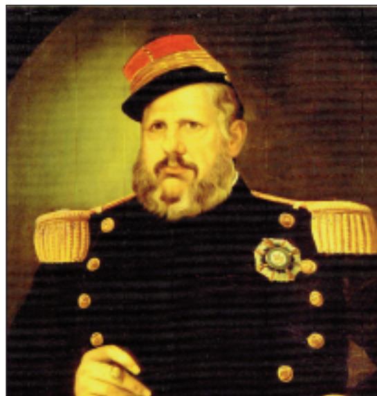
Ferdinando II (1810-1859), re del Regno delle Due Sicilie dal 1830 al 1859. Per la ferocia con cui domò la rivolta siciliana del 1848 fu chiamato "Re Bomba".