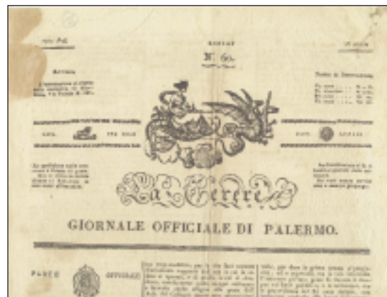
Testata del "Cerere Giornale Ufficiale di Palermo" che pubblicò il bando del 22 luglio 1843 per il popolamento di Lampedusa.

Scriva il Tranchina che partiti gendarmi e galeotti si credette di poter vivere come "una famiglia non costretta più a sentire ... i sozzi parlari di tanti galeotti... né più la burbanza ... dei comandanti borbonici" 14 . Ed aggiunge che gli Usticesi aderiro-