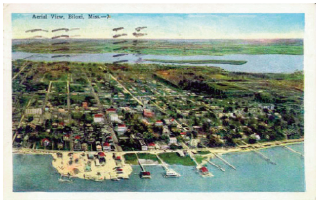
Aerial View, Biloxi, MS. Veduta aerea di Biloxi, nel Mississippi.

music from the time, when he was a youngster, that a Negro taught him the scales on a trumpet, until he died. He began playing with the Morgan City City Kids band . He organized a band while he worked at Godchaux's in New Orleans and it played for the Godchaux's employee outings. He organized Bertucci's Band at the New Orleans Skating Rink in 1902. Eight years later, he headed Bertucci's Military Band . During his years in vaudeville, his band was the Imperial Jazz Band .