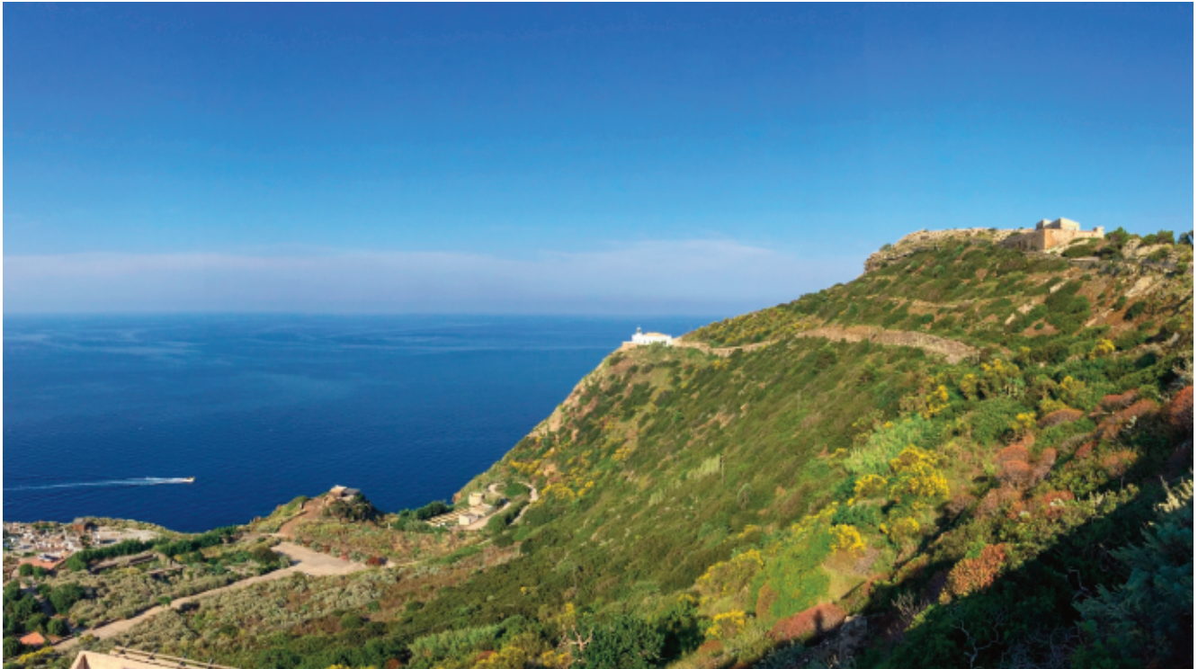
Una veduta dell'interno del vulcano con il neck su cui è situata una casetta.

essi sono ordinatamente disposti, i più grossolani sotto e quelli più fini sopra; in altri casi la stratificazione è caotica. Di tanto in tanto spiccano dei blocchi di grandi dimensioni, al di sotto dei quali gli strati appaiono piegati. Teniamo conto di tutto ciò per capire, fra poco, come possono spiegarsi queste configurazioni. Un'altra cosa da notare è la diversa colorazione degli strati tufacei della Falconiera , che sui versanti settentrionale e occidentale appare prevalentemente grigio-scura; mentre su quelli meridionale e orientale giallo-ocra.