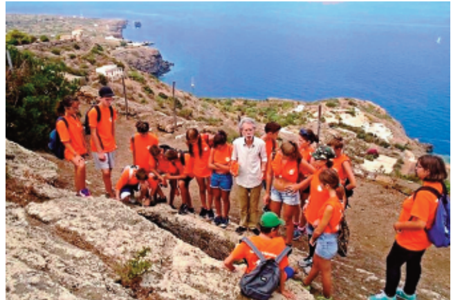
Sopra e nella pagina precedente, momenti di incontri didattici con giovani universitari e con scolaresche.

breve sella. E poi l'ampia distesa di Tramontana , risultato di terrazzi sedimentari marini che hanno ricoperto quello che sembra essere il più grande cratere nascosto dell'isola, protagonista di una possente eruzione sub-pliniana circa 425 mila anni fa 4 . Volgendoci al versante meridionale, forse non serve evidenziarlo, è incantevole la vista che domina il Paese e Cala Santa Maria .