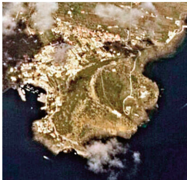
La Falconiera vista dall'alto.

ricorda la venuta dei regnanti (Vittorio Emanuele III ed Elena) a Ustica in seguito alla sequenza sismica del 1906, si svolti a destra per la salita che porta alla Falconiera . I due percorsi appena descritti, a un certo punto si ricongiungono e proseguono