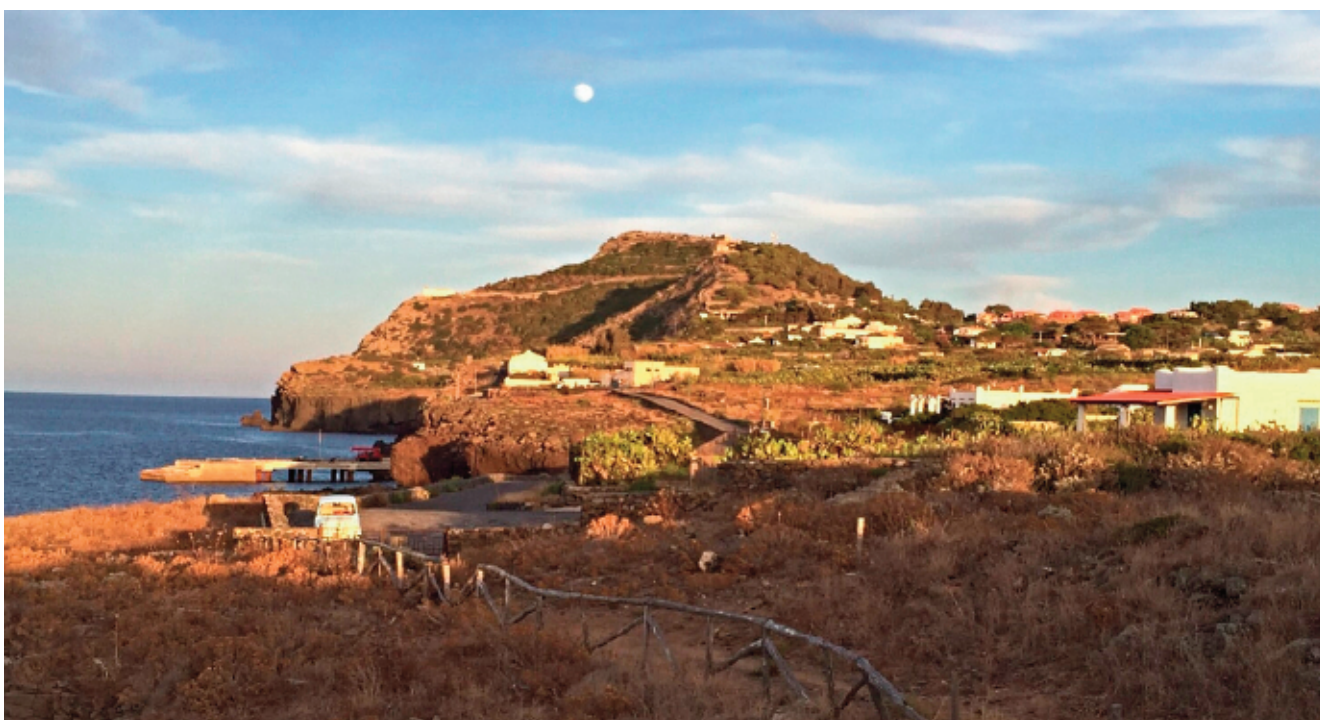
La Falconiera vista dalla Tramontana.

Il secondo itinerario permette di apprezzare meglio, fin dall'inizio, i materiali eruttati dal vulcano e la loro giacitura. Infatti, la stradina che fu tagliata sui fianchi del monte, mette in evidenza strati di ceneri e lapilli poco compattati, che immergono verso valle, a tratti rovinando sulla strada in frammenti più o meno grandi. In alcune sezioni si può apprezzare la varia granulometria di questi depositi, che possono essere fini come il talco, più corposi come granelli di zucchero, o grossolani come il pietrisco. Guardando da vicino gli strati che raccolgono tutti questi frammenti, se ne potrà trovare qualcuno in cui