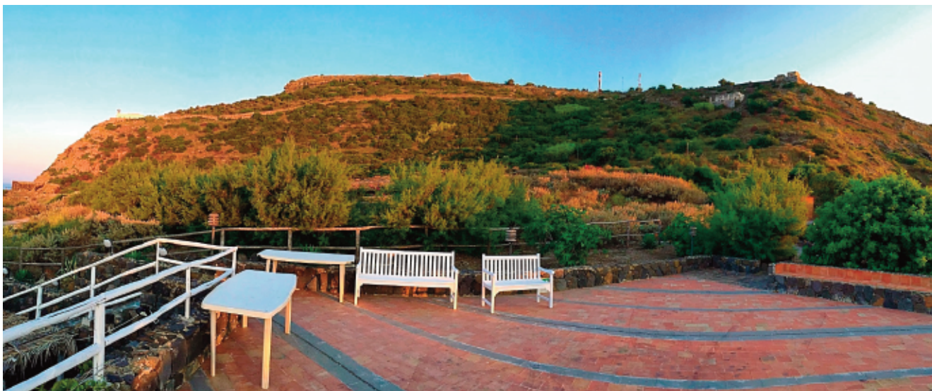
La cima della Falconiera vista dall'interno del cratere.

strati tufacei questa disposizione. Fra gli strati si trovano anche sassi scuri, di più grandi dimensioni che sono o blocchi a spigoli vivi di lave già consolidate, strappate al condotto vulcanico dalla furia esplosiva; oppure frammenti più densi e corposi di magma proiettati in aria, arrotondati e raffreddati in volo. Entrambi, cadendo sugli strati di ceneri e lapilli ancora morbidi, possono avere creato vistose piegature, le quali permettono, attraverso calcoli balistici, di ricostruire la traiettoria di provenienza del proietto.