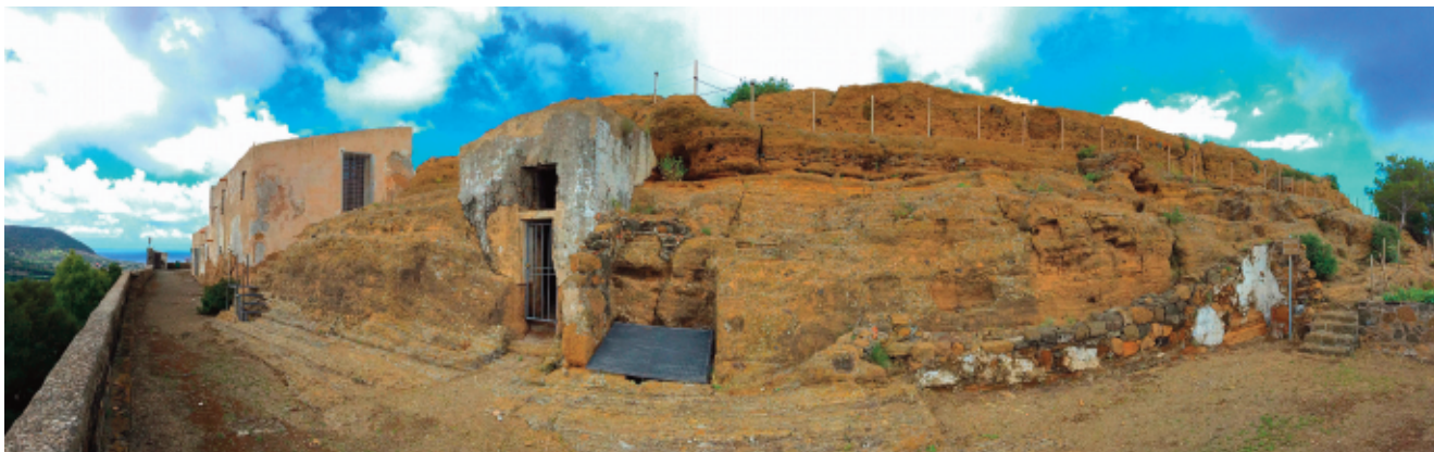
La Rocca e al suo interno il percorso archeologico.

troviamo fu realizzata proprio sull'orlo del cratere. Dalla parte in cui ci siamo appena affacciati, si domina il fondo e quel che resta dell'interno del cono craterico; dalle altre parti si possono ammirare i versanti esterni dello stesso cono e rendersi conto come cambiano le immersioni degli strati. Di qui, soprattutto, si ha una visione a volo d'uccello di alcune delle più importanti emergenze geo-vulcanologiche dell'isola: a sud il Monte Guardia dei Turchi (248 m) che fu il primo vulcano emerso dell'isola, oggi sormontato dalla bianca cupola che protegge un impianto radar; a ovest il monte Costa del Fallo (238 m), unito al primo da una