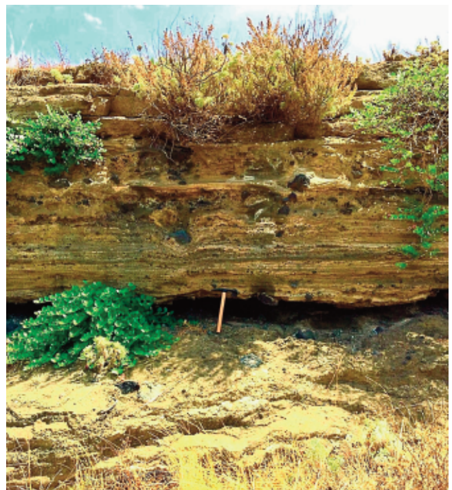
La Falconiera vista dall'alto.

cano, l'energia decrebbe. Nel frattempo si era formato un cono già elevato, sul cui fondo ristagnava un laghetto di lava. Anche da questo laghetto, nelle successive fasi eruttive, si sollevano brandelli di magma che ricascavano sotto forma di ceneri e lapilli. Così, attraverso la turbolenta attività della Falconiera , si sono formati sia i più caotici depositi da flusso, sia quelli granulometricamente più ordinati da caduta, i cui frammenti più pesanti arrivano al suolo prima di quelli più leggeri, conservando negli