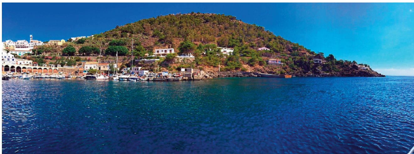
La Falconiera vista da Cala Santa Maria.

L'arrampicata alla Falconiera può prendere l'avvio da due cammini diversi. Dalla piazza del Paese si prenda via Calvario e giunti alla sommità, di fronte all'effigie del Cristo, si volga a sinistra: questo viottolo acciottolato conduce, in breve, alla strada della Falconiera . In alternativa, da via Petriera , a nord del Paese, dopo essere passati davanti al Municipio, si prenda la strada che porta al Camposanto e qui, poco dopo la lapide che