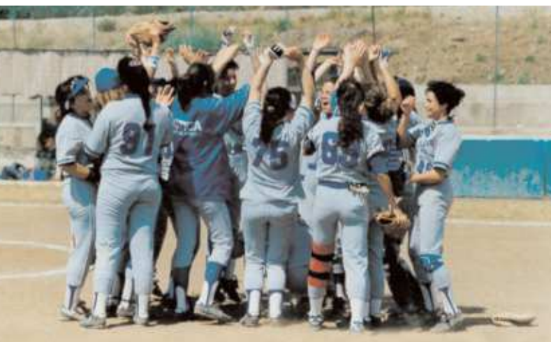
Le ragazze festeggiano la promozione in serie A1.

mare sotto gli occhi stupiti degli stranieri che ogni anno partecipavano al Trofeo delle Isole (nel film c'è una parte che mostra come giocare il baseball a mare).