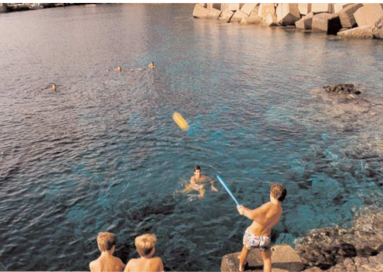
1898. Trofeo delle Isole a Cala Santa Maria con squadre francesi e cecoslovacche.