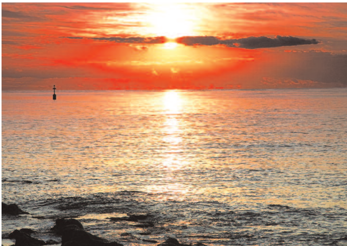
Tramonto a Ustica.