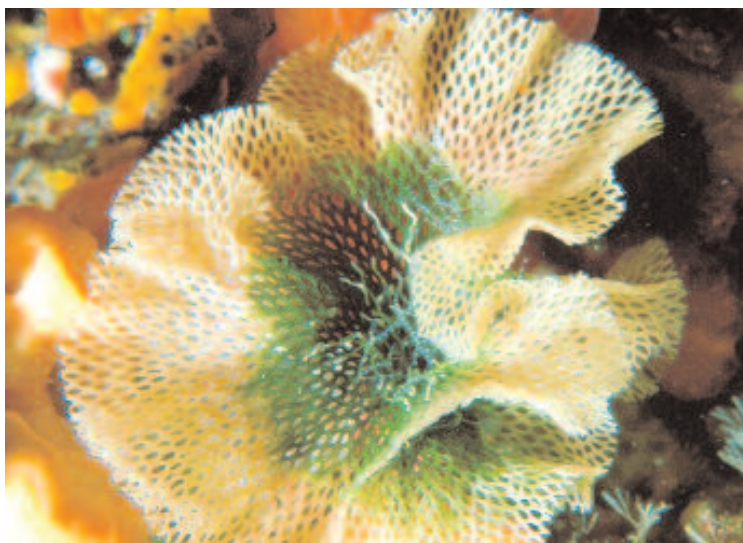
La rosa di mare, Sertella beaniana (King), ha un colore rosa salmone molto tenue e raggiunge la grandezza di 10 cm. Vive nelle zone d'ombra estreme del litorale roccioso, sui fondali duri e particolarmente sulle pareti delle grotte ad una profondità tra i 2 ed i 25 metri.

Se l'isolamento è prerogativa per il consolidamento della condizione identitaria, la situazione di separatezza dell'isola è conti-