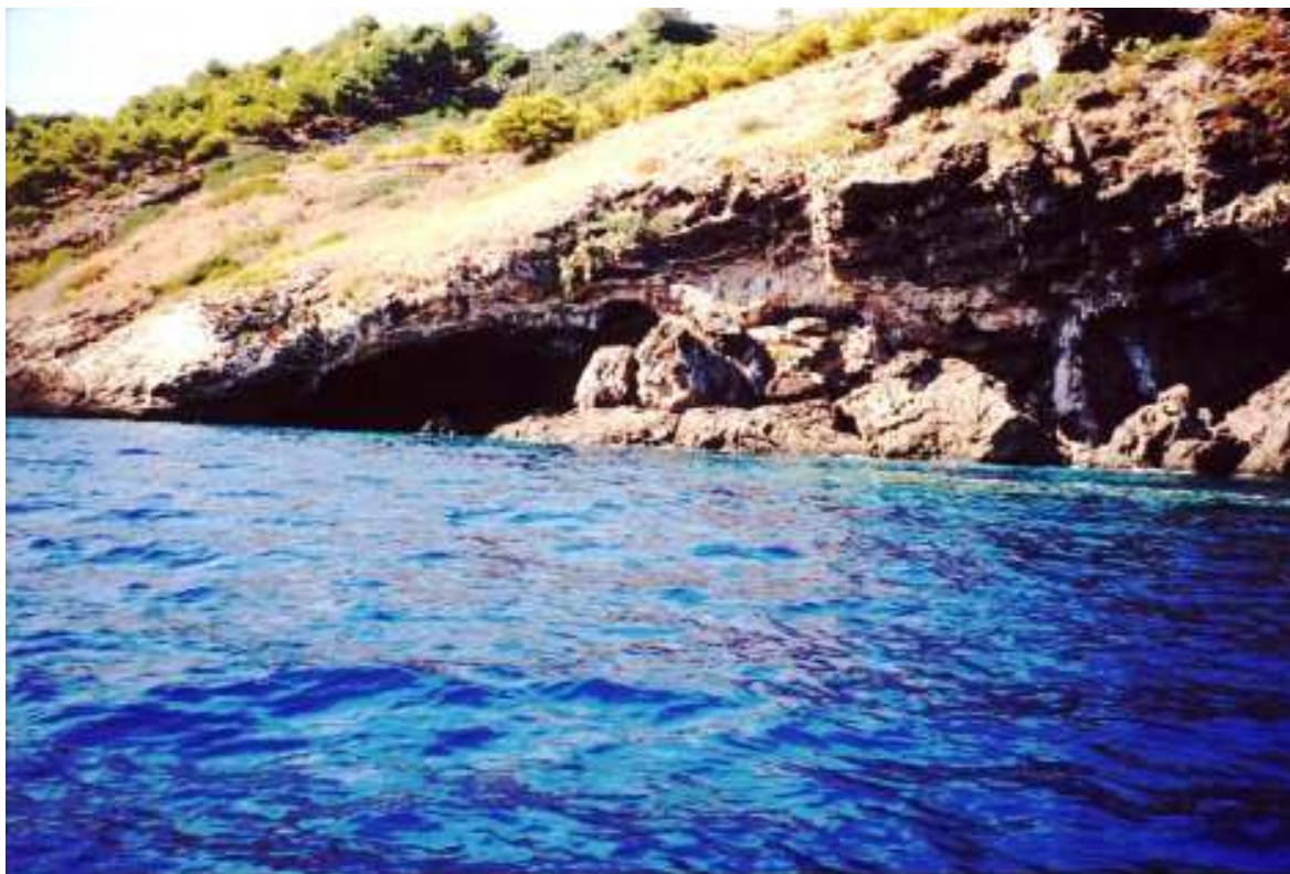
L'ingresso della Grotta delle Barche.