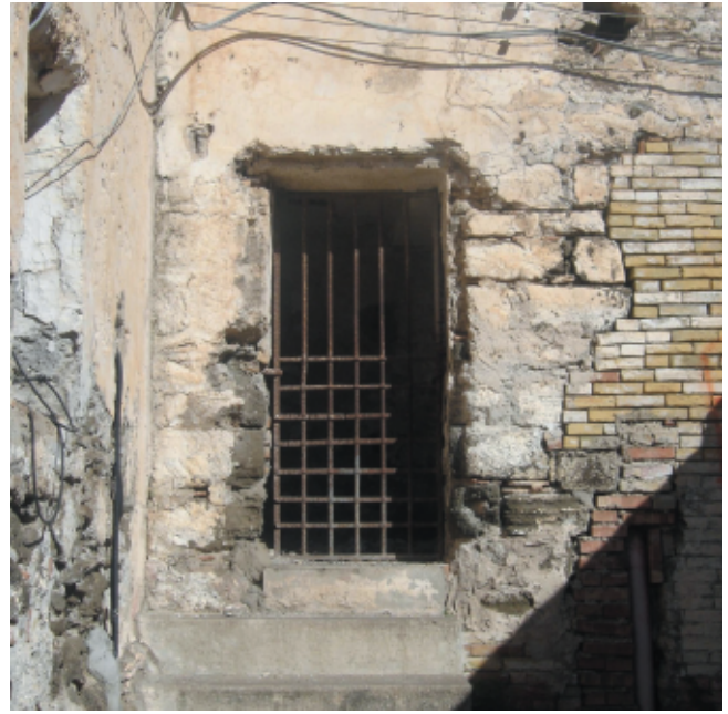
Cameroni dei confinati prima del recente restauro a seguito del quale sono stati destinati a Museo archeologico dell'isola. Particolare di una finestra che conserva ancora le grate di sicurezza.