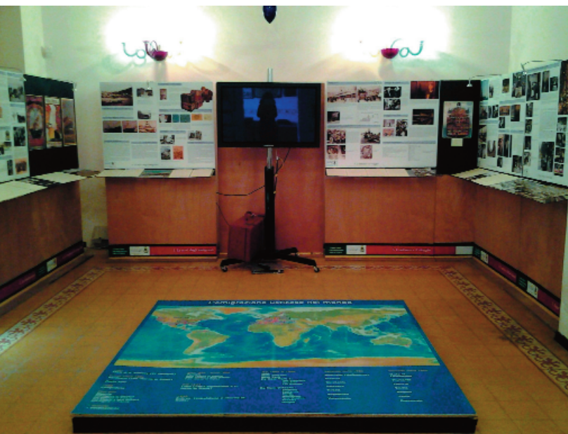
La prima sala del percorso espositivo, con al centro la grande carta geografica che indica tutte le destinazioni dell'emigrazione usticese.

The first exhibition room opens with a map in the centre, showing all the destination of Ustican emigrations.