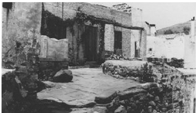
Due immagini di Ustica ai primi del Novecento: in basso una casa tipica di campagna e in alto il paese inquadrato dalla vicina altura su cui sorge una delle due torri di avvistamento a protezione degli abitanti costruita a metà del XVIII secolo.

Two Images of Ustica in the early twentieth century: on the bottom a typical countryside house and on the top an overview from the nearby hill, where is present one of the lookouts built to protect the inhabitants in the middle of eighteenth century.