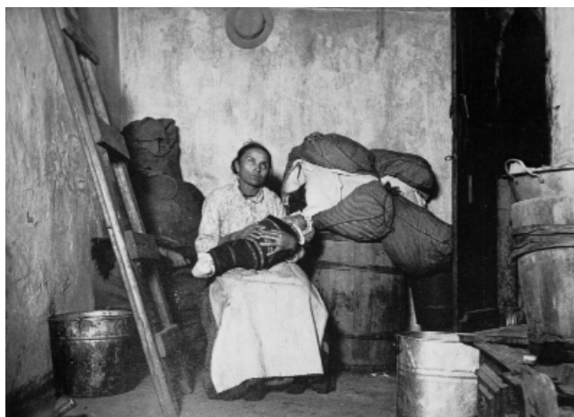
La casa di un straccivendolo italiano, Jersey Street. ca. 1890. Una madre con il suo bimbo avvolto strettamente nelle fasce com'era in uso in Italia tra le classi più povere e arretrate.

«A Bayard Street, nella Little Italy di New York, in un solo isolato di caseggiati che totalizzava 132 stanze, vivevano 1.324 italiani, per lo più uomini, operai siciliani che dormivano in letti accastellati con più di dieci persone per camera [...]. Spesso otto, dieci e più persone dormono in una sola camera, alcune di esse affette da tisi o altra malattia contagiosa» (Jacob Riis).