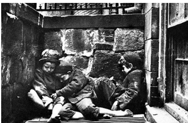
J. Riis. Una fredda notte in un vicolo di Mulberry Street a Manhattan. Tre piccoli immigrati scalzi si stringono insieme su una grata per raccogliere il calore che ne fuoriesce. 1890

Jacob Riis. Italian mother. Jersey Street. ca. 1890