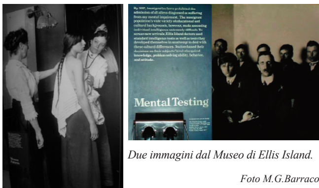
Due immagini dal Museo di Ellis Island.