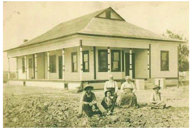
Una famiglia usticese emigrata a New Orleans si fa ritrarre riunita davanti alla nuova e grande casa, segno di un benessere finalmente conquistato.

Slowly the new immigrant communities while maintaining bonds with the country of origin began integrating with the society of the country that had welcomed them, thanks, especially to education, to religion, to associations, to the Press, and of course through their hard work which, initially occupied the Italians with in most humble and laborious of trades. New private and parochial schools were raised to support the correct integration of young people and also to preserve the cultural heritage of their "forefathers". The communities concentrated around the parishes: the steadfast faith of the Italians rich in symbols, saints, processions and religious festivals supported the community life. They formed relief organizations of great importance, with the purpose of mutual aid among immigrants. With the publication of brochures, newsletters, newspapers, weeklies the Press held a work of cultural mediation between immigrant communities, the country of settlement and Italy. And finally 'the house': the achievement of having your own home was one of the most significant moments of integration into the destination country.